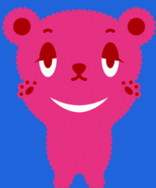
サポステ公式キャラ わーくまちゃん