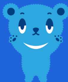
サポステ公式キャラ わーくまくん