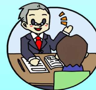
キャリアカウンセリング

社会人経験がない方、社会人としての基本的な知識・スキルを獲得したい方にお勧め。 このコースから開始する人は B \Rightarrow J \Rightarrow C 或いは B \Rightarrow C の段階で就職に向かいます。 就職決定まで概ね4ヶ月程度を目安としたコースです。