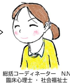
総括コーディネーター N.N 臨床心理士・社会福祉士

くまもと若者サポートステーションでは、 現在、就職活動中の方のみでなく、 サポステを利用して就職し、現在、就労中の方（卒業生）、 サポステ利用者のご家族にむけての講座も行っています！ 月のスケジュールは前月の下旬にホームページに掲載されます。 是非、チェックしてお申し込みください！