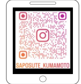
くまもと若者サポートステーション 公式Instagram